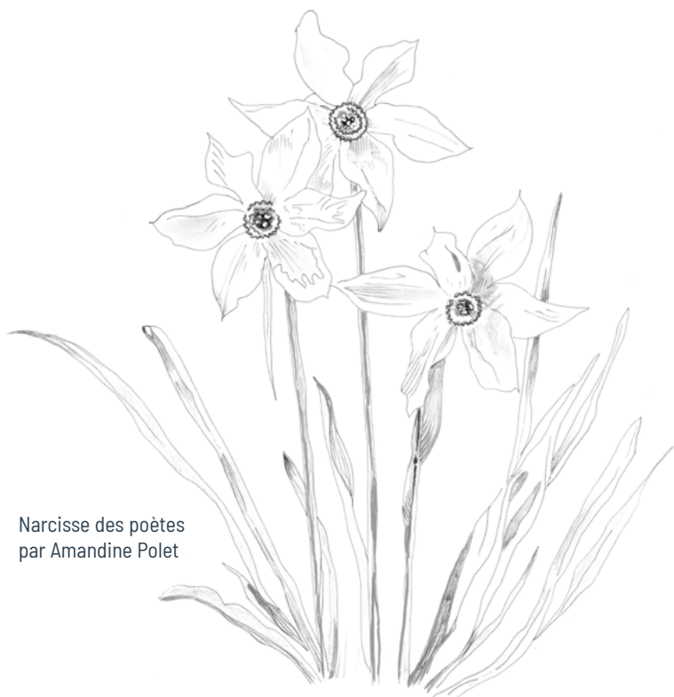
Narcisse des poètes par Amandine Polet

Se définissant comme « artiste », Amandine Polet développe une pratique artistique engagée à la croisée de l'art, de la poésie et de l'écologie. Installation, illustration, poésie et photographie composent son travail pluridisciplinaire sensible, pensé comme un laboratoire reliant arts et sciences. Son geste artistique cherche à révéler la fragilité du vivant et à réinventer notre relation à la nature afin de mieux la préserver.